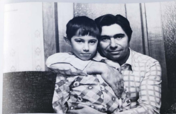
Отцы и дети ))